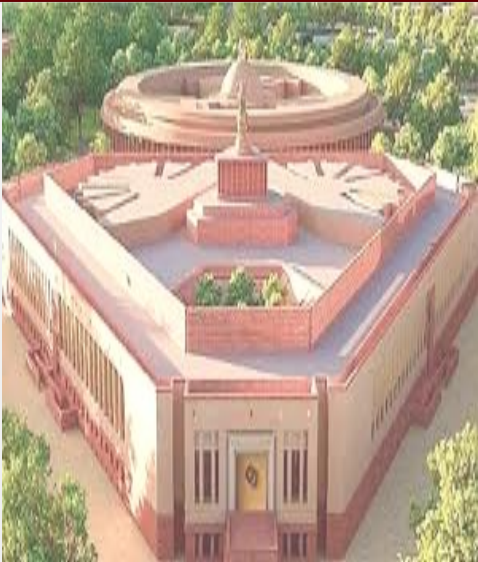
देश की आन बान और शान - संसद भवन